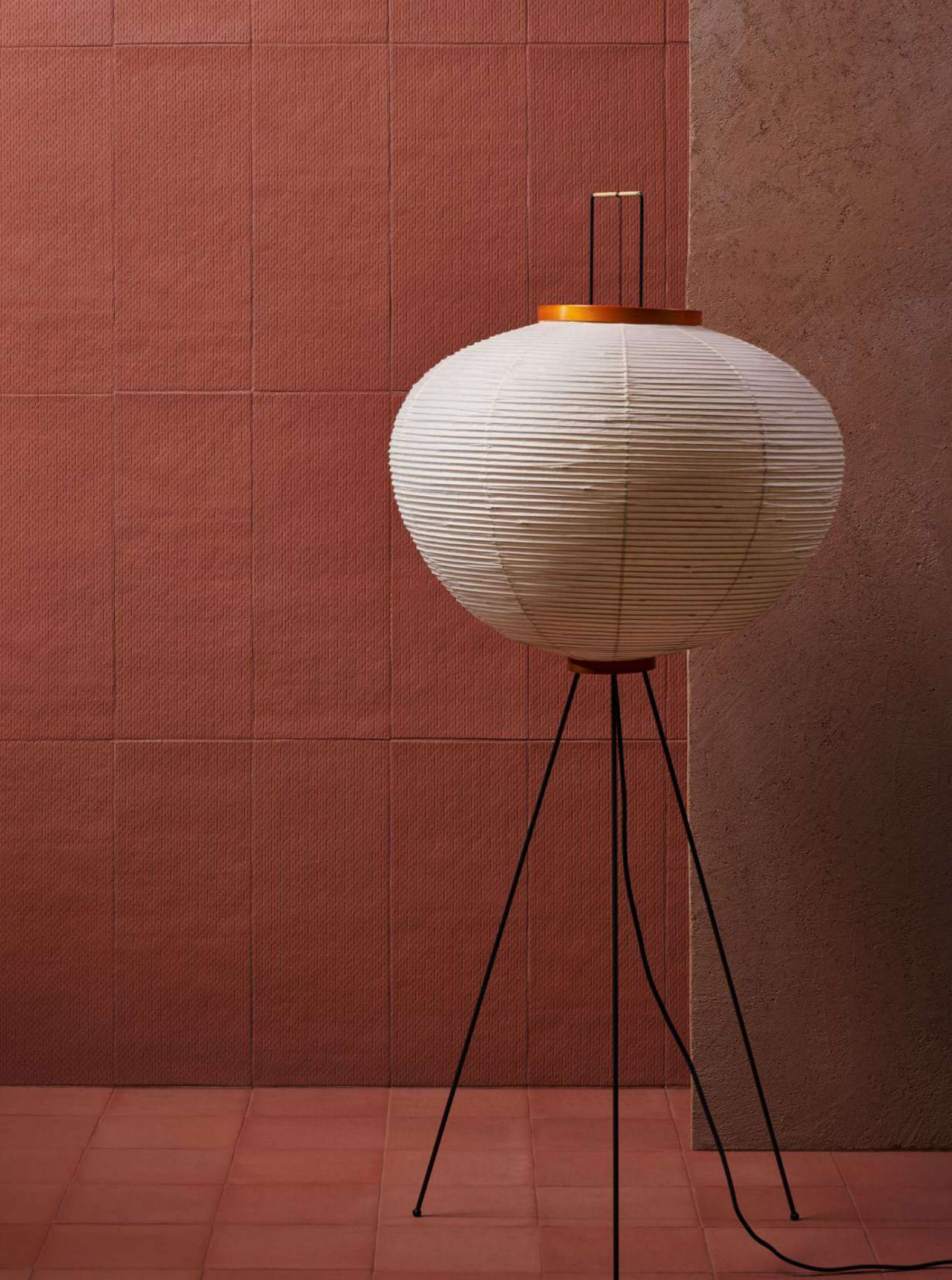
Parete / Wall: Seed Clay Pavimento / Floor: Elba collezione Mediterranea