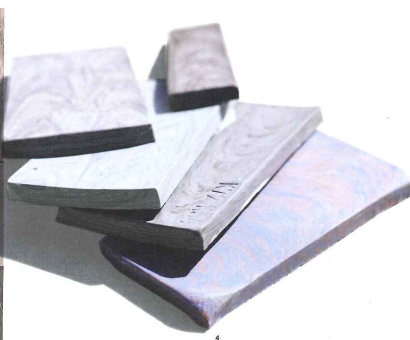
1. L'impasto di NeoClay™. 2. Trafile con la miscela di Firenze, design Rodolfo Dordoni. 3-4. Prototipi di Firenze in differenti colorazioni